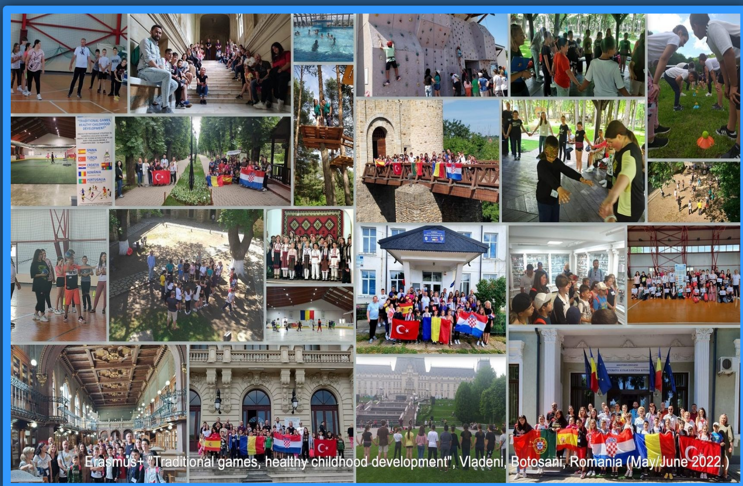
Erasmus+ "Traditional games, healthy childhood development", Vladeni, Botosani, Romania (May/June 2022.)